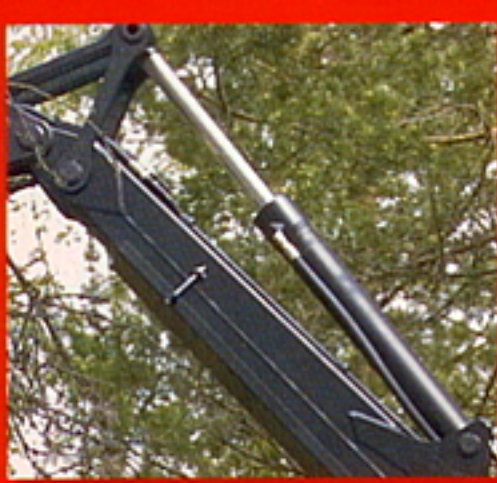
Les vérins sont dimensionnés pour les fortes pressions et les mouvements rapides